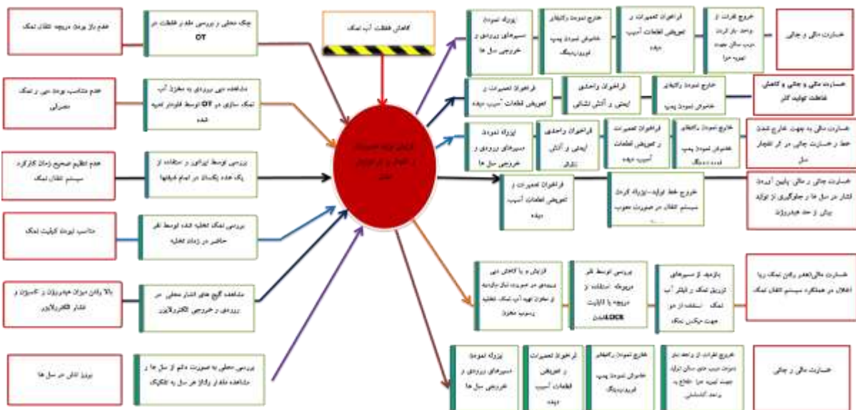
شکل ۱: دیاگرام Bow-Tie کاهش غلظت آب نمک و ریسک انفجار مخزن ذخیره کلر به دلیل افزایش فشار هیدروژن

تحلیل ریسک های شناسایی شده به روش Bow-Tie پس از بررسی ریسک های محتمل واحد، شناسایی رویدادهای مهم (Top Event) ناشی از نتایج ارزیابی ریسک به روش HAZOP، ۷ رویداد مهم شامل ریسک ترکیب در مسیر های