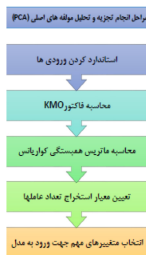
شکل ۱- مراحل تحلیل مولفه‌های اصلی (PCA)

این الگوریتم برای ساخت یک درخت تصمیم‌گیری، داده‌ها را متناوباً به زیر مجموعه‌های مشابه افزایش می‌کند تا آنجا که هر زیر مجموعه دارای تعداد مشخصی نمونه شود. این الگوریتم می‌تواند درختی تولید کند که در برخی از مواقع به صورت غیر دو دویی عمل کند، در واقع از روش جدا کردن چند تایی به جای جدا کردن دو دویی استفاده می‌کند. در این روش از مقدار P-Value آماره کای-دو مربوط به آزمون استقلال جداول توافقی، استفاده می‌شود. از بین متغیرهای موجود، متغیری که دارای P-Value کوچک‌تری باشد در مرحله اول برای تقسیم‌ها روی یک گره در نظر گرفته می‌شود. به بیان دیگر، CHAID ابتدا تفاوت‌های هر نمونه را با سایر نمونه‌ها می‌یابد و درخت مورد نظر را تولید می‌کند. هرس کردن درخت از طریق یافت تفاوت‌های مشابه انجام می‌شود. جهت اعتبارسنجی مدل درختی، داده‌ها به دو بخش داده‌های آموزش و آزمون تقسیم شدند مدل درختی با استفاده از داده‌های آموزش ساخته شد و مدل ساخته شده بر روی داده‌های آزمون مورد تست قرار گرفتند. درصد نمونه‌هایی از داده‌های آزمون که ویژگی هدف آنها توسط مدل، درست تشخیص داده شده بود دقت مدل