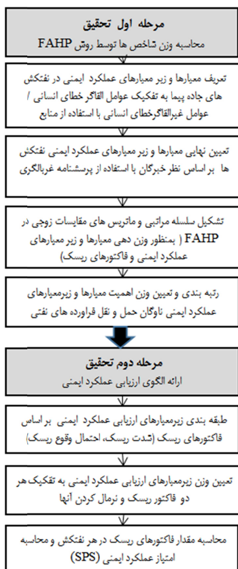
شکل ۱- مراحل اصلی مطالعه

الفاکر خطای انسانی" و "عوامل فنی غیر الفاکر خطای انسانی" مورد مطالعه قرار گرفت. مراحل انجام این تحقیق بر اساس اطلاعات جمع آوری شده از واحد HSE شرکت پخش فرآورده‌های نفتی ایران، نظر تیم خبرگان، آمار حوادث، مشاهده و ممیزی، منابع کتابخانه‌ای در دو گام اصلی انجام گرفت. مراحل انجام این تحقیق در شکل ۱ نشان داده شده است.