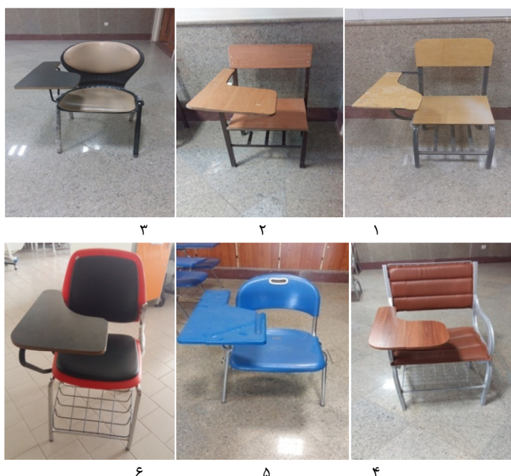
شکل ۱- صندلی‌های مورد ارزیابی جهت بررسی رضایت‌مندی دانشجویان در مطالعه حاضر

این صندلی‌ها خشنود بودند. در رابطه با سایر صندلی‌ها خشنودی کامل بسیار کم بوده و بیش‌ترین درصد رضایت کامل در صندلی شماره ۳ مشاهده گردید. میزان رضایت از تک تک ابعاد صندلی‌ها نیز در جدول ۲ نشان داده شده است. بنا بر این جدول، بیش‌ترین درصد رضایت از ابعاد مختلف صندلی، به صندلی‌های ۶ و ۴ اختصاص یافت. البته لازم به ذکر