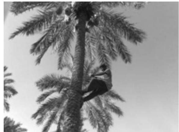
الف. عملیات بالای نخل - صعود

به‌رغم جایگاه ارزشمند تغذیه‌ای و اقتصادی نخل خرما بین ساکنان مناطق خرماخیز به‌ویژه کشور ایران، اندک مطالعاتی که درباره توسعه مکانیزاسیون تولید میوه خرما به‌طور اعم و برداشت میوه خرما به‌طور خاص صورت گرفته،