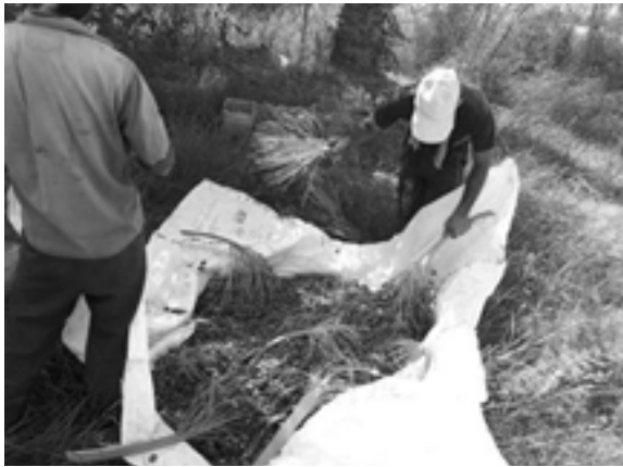
د. عملیات پایین نخل - تکاندن خوشه‌ها