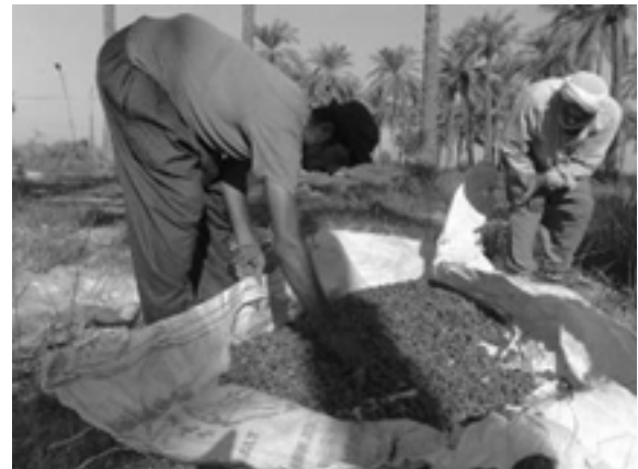
ه. عملیات پایین نخل - جداسازی برخی میوه‌های ناسالم