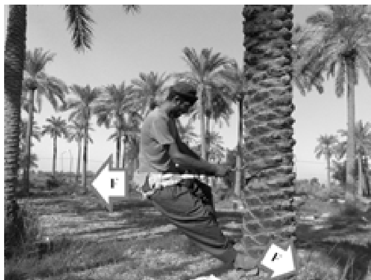
شکل ۳. حفظ تعادل همراه با اعمال فشار و نیرو هنگام عملیات بالای نخل