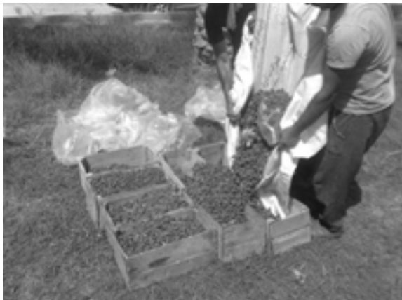
و. عملیات پایین نخل - ریختن میوه‌ها در جعبه‌های چوبی