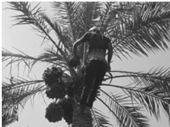
ب. عملیات بالای نخل - برش خوشه

این مطالعه همزمان با فصل برداشت خرما در ماه‌های شهریور و مهر سال ۱۳۹۵ در نخلستان‌های دانشگاه علوم کشاورزی و منابع طبیعی خوزستان و برخی نخلستان‌های شهرستان رامهرمز انجام شده است. ارزیابی و مقایسه‌های ارگونومیکی شامل ارزیابی‌های فیزیولوژیکی (ضربان قلب و دامنه ضربان قلب) و ارزیابی‌های فیزیکی (میزان درد و ناراحتی اعضای بدن) هنگام برداشت دستی نخل خرما و هنگام اجرای عملیات بالا و پایین نخل خرما صورت گرفت. عملیات بالای نخل خرما شامل صعود، برش خوشه و نزول بود و عملیات پایین نخل خرما شامل فعالیت‌های تکاندن خوشه‌ها (جداشدن میوه‌ها از خوشه)، جداکردن برخی میوه‌های ناسالم و ریختن میوه‌ها درون جعبه‌های چوبی بود (شکل ۱). مدت زمان هر یک از عملیات با استفاده از زمان‌سنج برای کارگری حرفه‌ای که کار خود را در آن عملیات خاص در مدت زمان معمول انجام می‌دهد، اندازه‌گیری شد. عملیات و مدت زمان هر عملیات در برداشت دستی نخل خرما برای نخل‌های با حدود ۷ متر ارتفاع و ۷ خوشه در نظر گرفته شد (جدول ۱).