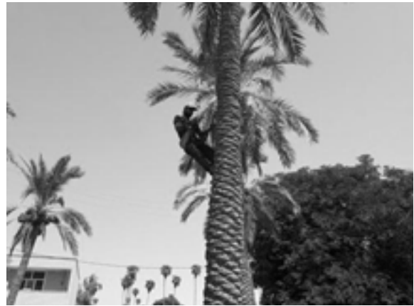
ج. عملیات بالای نخل - نزول ب. عملیات بالای نخل - برش خوشه