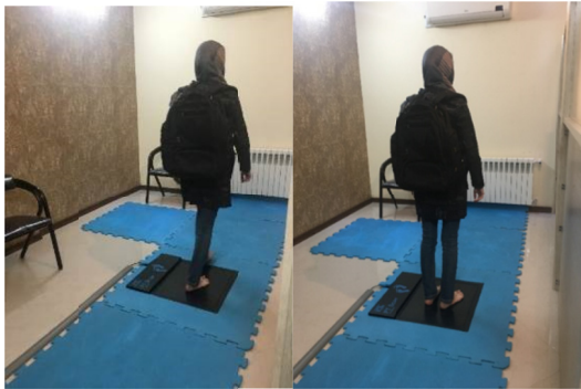
شکل ۳- ثبت فشار کف پا در حالت راه رفتن و استاتیک با کوله پشتی جدید ارگونومیک

اطلاعات و عدم استفاده از نام شرکت کنندگان رعایت گردید. آزادی نمونه‌ی مورد پژوهش حفظ و حق کناره گیری از مشارکت در هر زمان و در هر بخش از پژوهش برای آن‌ها در نظر گرفته شد و از شرکت کنندگان در پژوهش هزینه‌ای جهت انجام معاینات دریافت نشد.