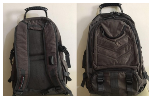
شکل ۲- کوله پشتی رایج

میانگین وزن بدن را در هر یک از کوله‌پشتی‌های طراحی شده و رایج در ۳ حالت استاتیک و دینامیک و تعادل حمل کرد. داخل هر کوله‌پشتی کتاب‌های مختلف با وزن مشخص قرار داده شد. میانگین وزن حمل شده توسط شرکت‌کنندگان ۵/۵۶ کیلوگرم بود. کوله‌پشتی‌ها تا حد امکان نزدیک به بدن قرار داده شدند و بندهای ناحیه‌ی شانه به صورتی تنظیم شد که قسمت انتهایی کوله‌پشتی در گودی کمر قرار گرفته باشد. اندازه‌گیری فشار طی راه رفتن با روش قدم‌یابی صورت گرفت. به این منظور از فرد خواسته شد مسیر مشخصی را که در میانه‌ی آن صفحه حساس به فشار قرار دارد، با سرعت راه رفتن طبیعی خود در راستای مستقیم طی کند و برای هر پا به صورت جدا ثبت فشار صورت گرفت. جهت اندازه‌گیری فشار در حالت ایستاده از فرد درخواست شد روی صفحه اندازه‌گیری فشار بایستد و به یک نقطه‌ی ثابت روی دیوار رو به رو به مدت ۱۰ ثانیه نگاه کند. وقتی فشار روی یک پا ۵۰ درصد کل فشار بود اندازه‌گیری ثبت شد.