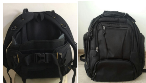
شکل ۱- کوله پشتی جدید ارگونومیک طراحی و ساخته شده