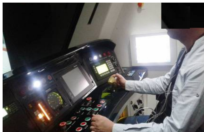
شکل (۲) - ثبت داده‌های فیزیولوژیک در حین راهبری

فردی و خستگی کلی Samn-Perelli را تکمیل کند و الکترودهای دستگاه ECG به وی وصل می‌شد (شکل ۲). برای سازگار شدن آزمودنی با دستگاه ECG نیز یک دوره ۵ دقیقه‌ای در نظر گرفته شد. سپس از راهبر خواسته شد طبق سناریوی اول و درحالی‌که سنج‌های فیزیولوژیک هم‌زمان ثبت می‌شد به مدت ۱۰ دقیقه راهبری کند. هر آزمون توسط یک دوره زمانی حدوداً ۱۰ دقیقه از هم دیگر جدا شدند. طی دوره زمانی استراحت، شبیه‌ساز برای مرحله بعدی آماده می‌شد و راهبر سنج‌های خستگی کلی Samn-Perelli، IWS و معیارهای وضعیت راحتی درک شده را تکمیل می‌کرد. سپس درحالی‌که سنج‌های فیزیولوژیک هم‌زمان ثبت می‌شد، از راهبر خواسته می‌شد به مدت ۱۰ دقیقه طبق سناریوی دوم راهبری کند. پس‌ازاین دوره، راهبر مجدداً سنج‌های خستگی کلی Samn-Perelli، IWS و معیارهای وضعیت راحتی درک شده را تکمیل می‌کرد. به‌منظور افزایش احساس اصالت مأموریت راهبری، به افراد اجازه داده می‌شد که با روش و استراتژی‌های حل مساله و سبک راهبری مختص به خود راهبری کنند. در حین دو آزمون