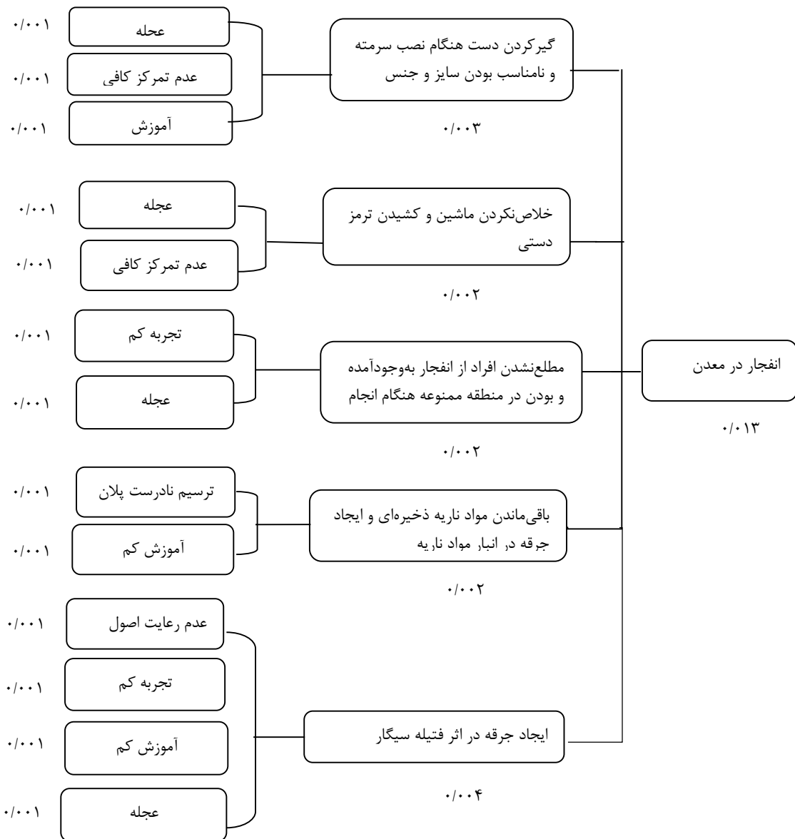
شکل ۳: نتیجه انجام تکنیک ATHEANA در انفجار در معدن

آنالیز هزینه- منفعت کنترل ریسک خطاها و غیره بستگی دارد [۱۸]. با توجه به ماهیت عملیات معدن کاری و لزوم انجام کار در فضای باز، از جمله عوامل مهم در معدن کاری که می‌توانند سبب رخداد خطای انسانی شوند، ایجاد جرقه در اثر فتیله سیگار و انجام کار در زیر نور مستقیم خورشید، دمای هوای خیلی زیاد یا خیلی کم و بارش نزولات آسمانی می‌باشند. فراهم کردن محیطی بدون استرس برای کار در این شرایط که هم ایمنی کافی را فراهم آورد و هم پارامترهای شرایط جوی را تحت کنترل داشته باشد، می‌تواند نقش مهمی را در کاهش خطای انسانی معدن کاران ایفا نماید.