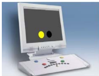
شکل (۲) - تست کامپیوتری RT