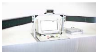
شکل (۳) - تست کامپیوتری PP