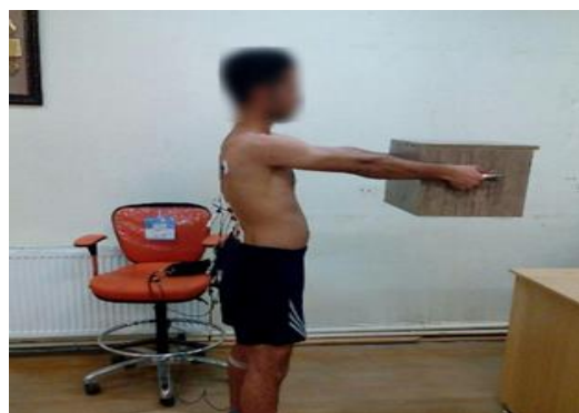
شکل ۱. نحوه قرارگیری آزمودنی‌ها برای انجام آزمایش‌ها

موفق) انجام شد و میانگین متغیرهای مربوط، در ۵ حرکت محاسبه شد. بین تلاش‌های آزمون در هر کدام از دو وضعیت (همچنین بین تعویض آزمون‌ها از حالت نگه‌داشتن ایستا به حالت برداشتن پویا)، دست‌کم ۳۰ دقیقه به آزمودنی‌ها استراحت داده می‌شد تا خستگی انجام تست برطرف شود. نحوه انجام آزمون‌ها نیز در وضعیت‌های با گوه پاشنه و بدون آن، به صورت تصادفی بود تا اثر یادگیری و ترتیب اجرای آزمون روی داده‌های ثبت شده خنثی شود. گوه استفاده شده در پژوهش حاضر از جنس چوب با این ابعاد بود: طول ۷ سانتی متر، عرض ۵ سانتی متر و ارتفاع ۱ سانتی متر با زاویه ۸ درجه، که میان چوب در زیر پاشنه پاها قرار داده می‌شد [۹].