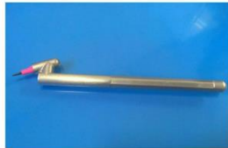
شکل شماره ۱. مداد ارگونومیک طراحی شده